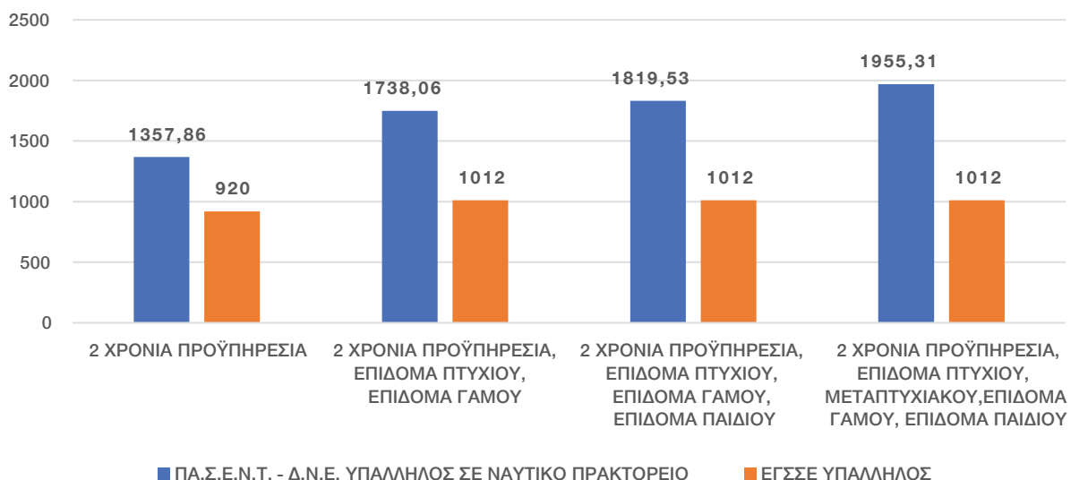
ΣΥΓΚΡΙΣΗ ΣΣΕ ΥΠΑΛΛΗΛΩΝ ΣΕ ΝΑΥΤΙΚΑ ΠΡΑΚΤΟΡΕΙΑ (ΠΑ.Σ.Ε.Ν.Τ. - Δ.Ν.Ε.) & ΕΘΝΙΚΗ ΓΕΝΙΚΗ ΣΣΕ (ΕΓΣΣΕ)