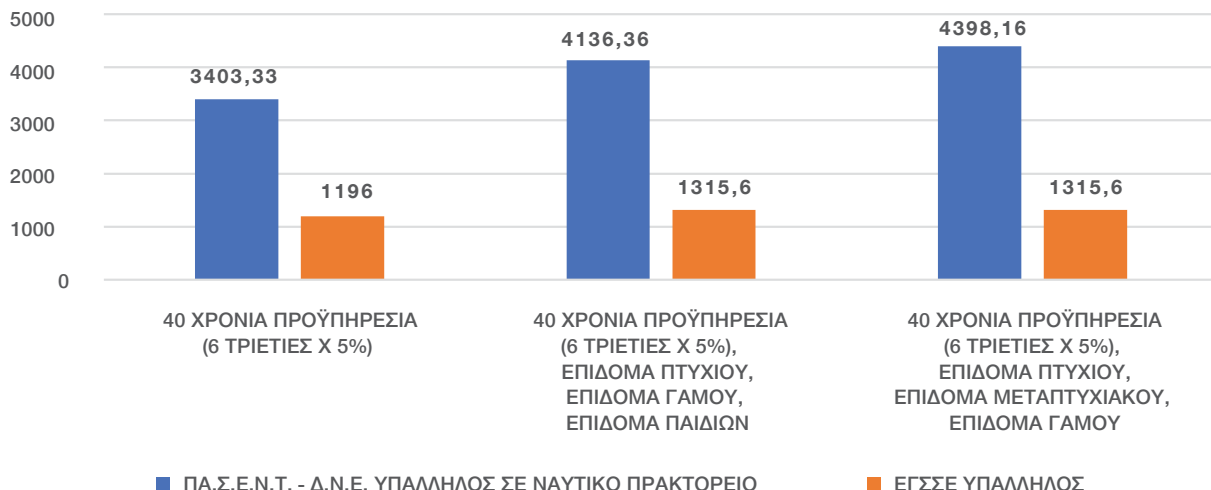
ΣΥΓΚΡΙΣΗ ΣΣΕ ΥΠΑΛΛΗΛΩΝ ΣΕ ΝΑΥΤΙΚΑ ΠΡΑΚΤΟΡΕΙΑ (ΠΑ.Σ.Ε.Ν.Τ. - Δ.Ν.Ε.) & ΕΘΝΙΚΗ ΓΕΝΙΚΗ ΣΣΕ (ΕΓΣΣΕ)